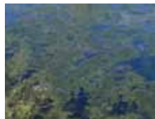
Fadenalgen besitzen eine fadenartige Struktur. Sie setzen sich meist als „Teppiche“ oder „Nester“ an der Oberfläche, am Grund oder an Dekoelementen im Teich ab.