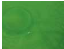
Grünes Wasser entsteht durch mikroskopisch kleine Schwebealgen, die sich oft explosionsartig vermehren. Man spricht von einer Algenblüte.

Von den vielen möglichen Algenarten werden im Gartenteich häufig nur die folgenden zum Problem: